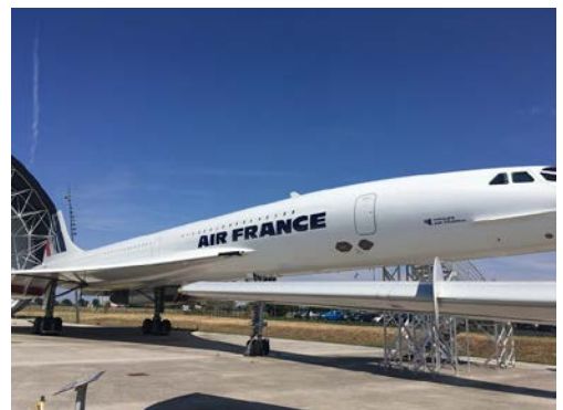
Fig. 2: An exhibit of Airbus in Toulouse