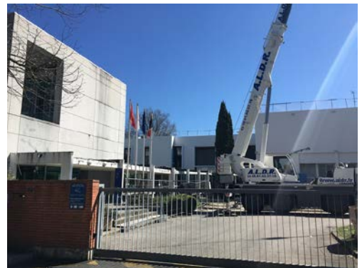
Fig. 1: Main Entrance of LAAS-CNRS under construction

The author visited LAAS-CNRS (Fig. 1) in Toulouse, which is one of the laboratories constituting the French National Center for Scientific Research (Centre national de la recherche scientifique: CNRS), the largest governmental research organization in France. Toulouse is famous for the air industry (Fig. 2), and associated companies and institutions are located in the city. The team of Methods and Algorithms for Control (MAC Team) is one of the research units in the laboratory, and I participated in the team as a visiting scholar. The team currently consists of 17 permanent researchers and about 10 PhD students and Post-Docs. Each of the offices for the team was shared by a couple of researchers (including visitors like me and PhD students), who had their own desks. The researchers can have passed between the offices without any barriers, and discussions and conversations started everywhere every day. Such an environment was very impressive, and affected me in the sense of change of mind for research activities. During this stay, I discussed not only with Dr. Peaucelle but also with many other researchers, and this was really a great experience.